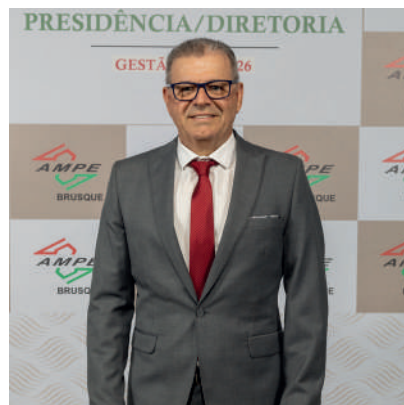
PRESIDENTE: IRAJÁ TRINDADE