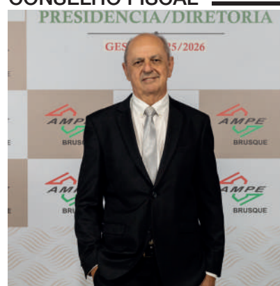
PRESIDENTE: ADERBAL MONTIBELLER