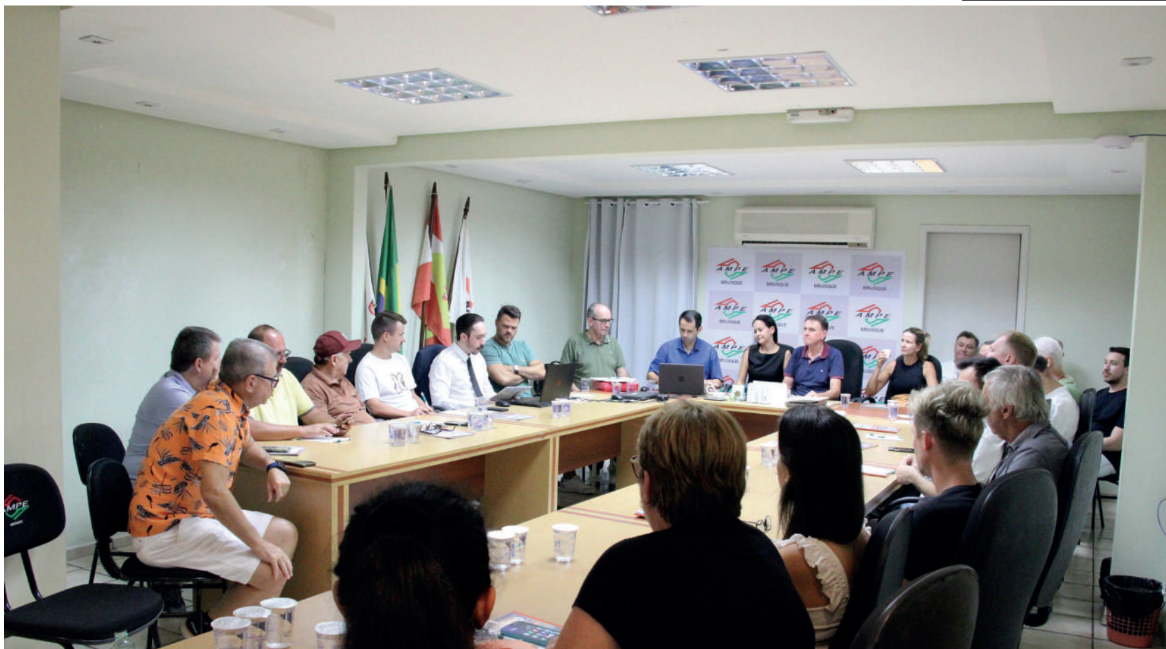
A reunião contou com a presença de integrantes da diretoria da entidade, além de associados, e da assessoria jurídica e contábil