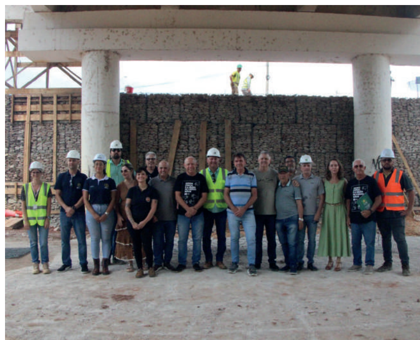
A visita aconteceu em conjunto com integrantes do Conselho das Entidades

"Essa iniciativa das entidades de fazer a vistoria in loco é muito importante para dar uma devolutiva aos associados. Temos recebido muitos questionamentos, principalmente sobre a obra da ponte, muitas informações desencontradas, e viemos verificar o andamento