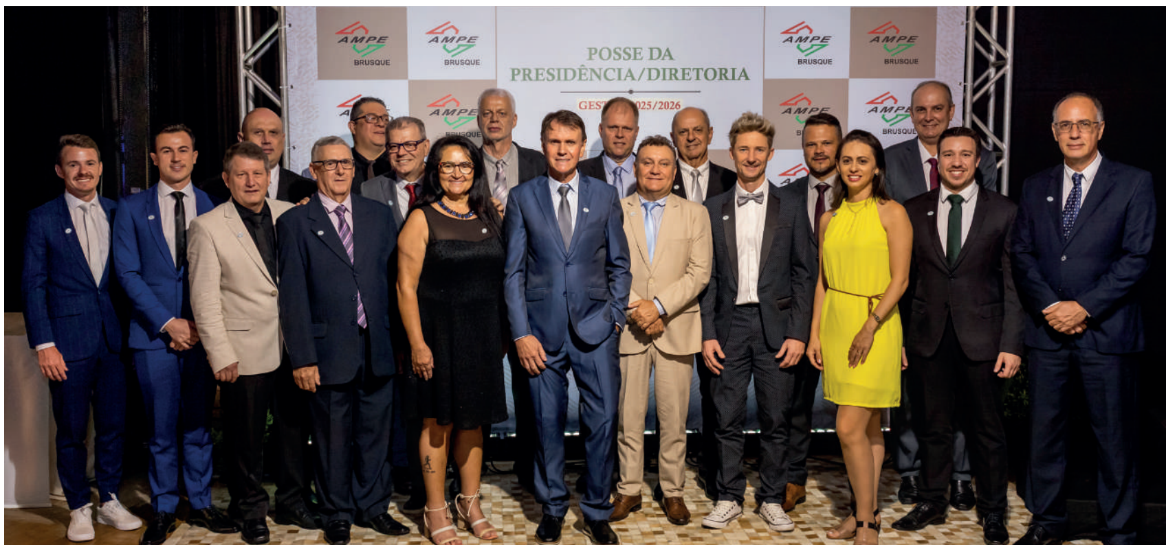
A diretoria da AmpeBr gestão 2025-2026